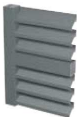
LAMELLES EN Z